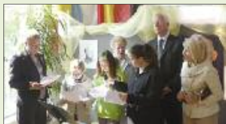
Lecture de la « Déclaration des petits citoyens de Petiville »