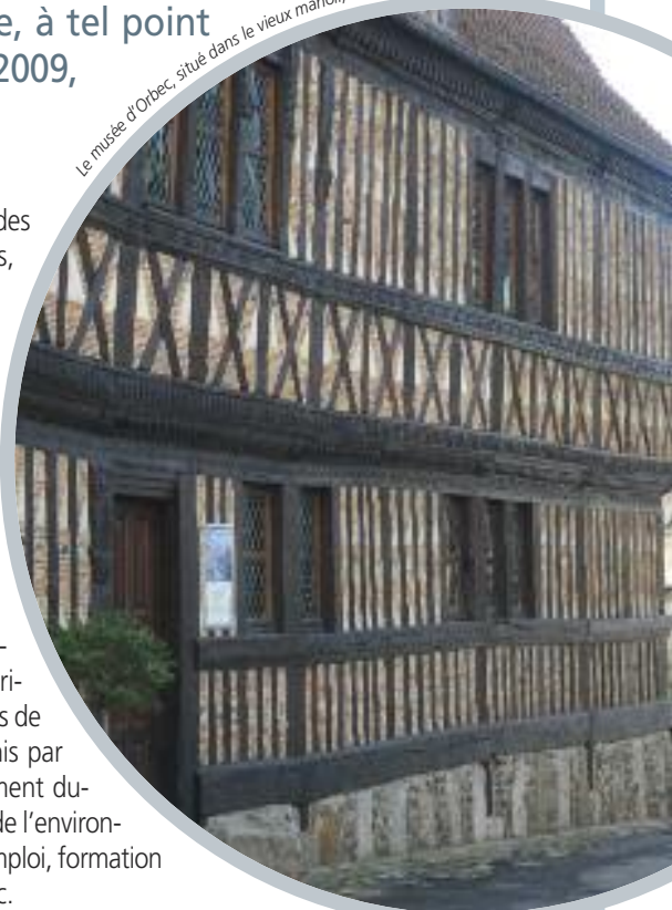
Le musée d'Orbec, situé dans le vieux manoir, a bénéficié d'aides européennes