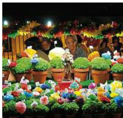
Les petits pots de basilic ornés d'un œillet en papier crépon (manjericos)