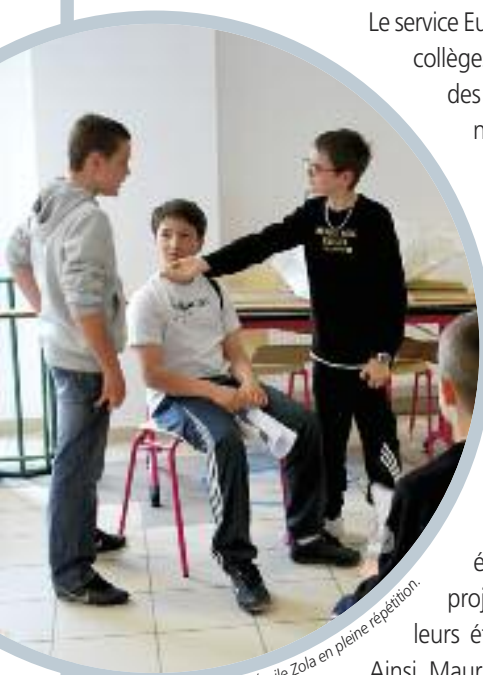
Les élèves du collège Émile Zola en pleine répétition.